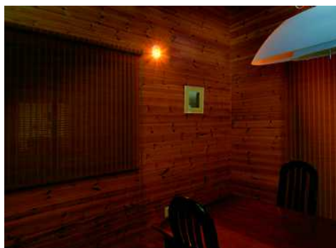
ライト ON 時のイメージ