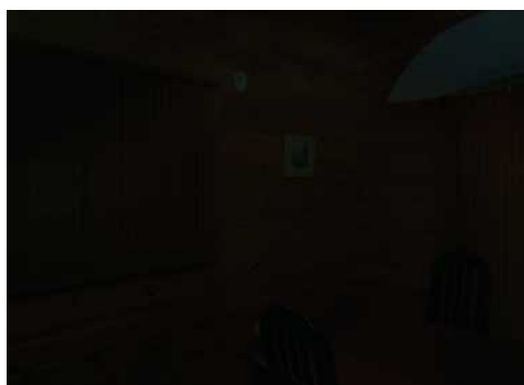
ライト OFF 時のイメージ

火災の際と同様に、夜間の震度 5 相当以上の地震発生時には、万が一停電が起きても、ライトの照明を頼りに安心し、落ち着いて避難することができます。